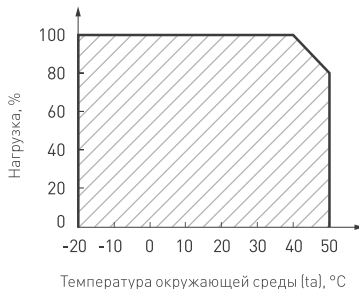
Рисунок 2. Максимальная допустимая нагрузка, % от мощности источника